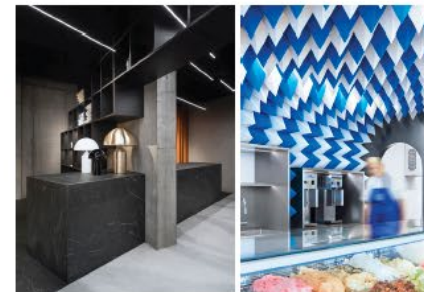
Verstunin Casa og ísbúð Perlunnar.

Eyjan sjálf er bæði stærri en gengur og gerist en einnig er hún sérstök í laginu. „Þessi tröppulögun gegnir ýmsum tilgangi. Hugmyndin var að þarna væri auðvelt að skapa rými fyrir uppstillingar, fallega rétti eða snittur og svo er jafnvel hægt að nýta þetta sem auka sæti. Það er líka hægt að nýta þetta sem baraðstöðu en það er samt smá bar innbyggður í innréttinguna til hliðar við eyjuna þar sem ég gerði upplýst flöskuborð og fina kaffiástöðu.“